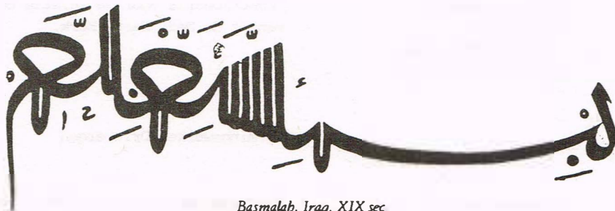
Basmalah, Iraq, XIX sec

Wij wensen U een gezegende en gelukkige viering van de 'id al Fitr toe.