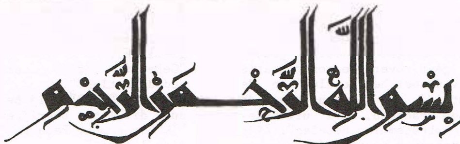
Basmālah, cufico orientale, Cairo, Egitto XI sec.

Deze vindt plaats van 11 - 21 juli in Birmingham. Folders over inhoud, prijs enz. bij de redactie.