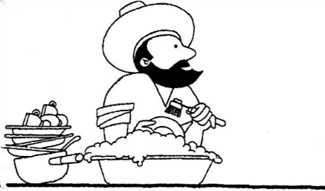
... hoe onze profeet hielp bij het huishouden

onze profeet zijn vrouwen hielp bij het huishouden, hoe hij zijn vrouwen hielp bij de opvoeding van de kinderen, hoe onze profeet nooit geschreeuwd heeft of zijn vrouwen een pak slaag gegeven heeft... Integendeel, als hij boos was drukte hij met