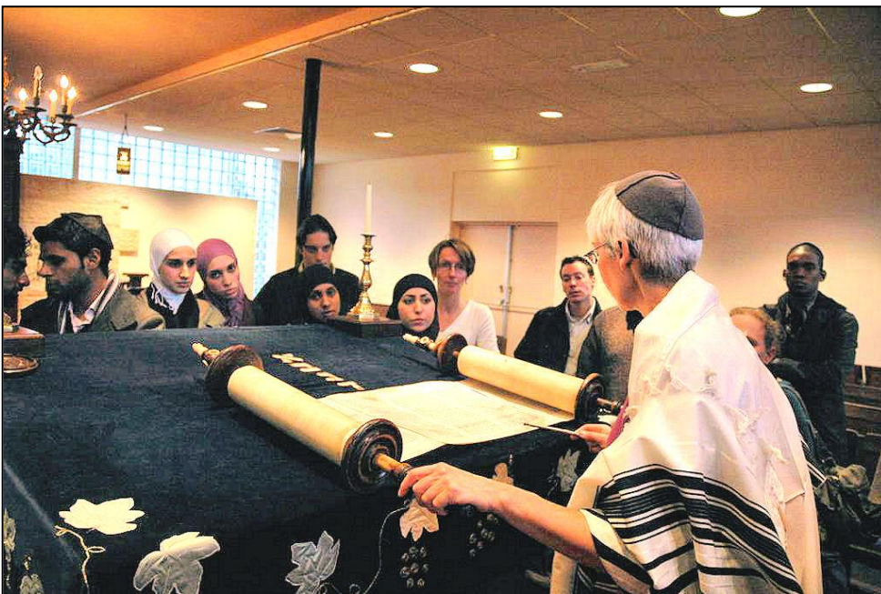
Moslimstudenten Hoge School Den Haag in de synagoge van Rotterdam