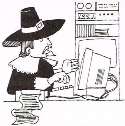
Fundamentalisme als reactie.

Bij vrijzinnige christenen, waar de grondregel van de tolerantie geldt en het gezag van de traditionele leer niet dominant aanwezig is, zien we een veel geleidelijker en minder traumatische acceptatie van homoseksuelen. Ook hier was de natuurlijke weerzin tegen homosexualiteit aanwezig, maar deze werd niet als 'zonde' geduid, maar aangegeven met de term 'onnatuurlijk'. De problematiek lag daardoor helderder op tafel en leed niet onder de zware last van het 'gezag van de Schriften'. Vrijzinnigen hadden het huiswerk van de tijd al gemaakt en konden hun homoseksuele broeders en zusters gemakkelijker de ruimte geven. De Remonstrantse Broederschap besloot in 1986 levensverbintenissen van homoseksuelen te erkennen en deze te zegenen. Daarmee concreet aangevend, dat de seksuele voorkeur van mensen geen scheiding behoeft te betekenen, maar dat deze verschillen door het geloof in Christus kunnen worden aanvaard.