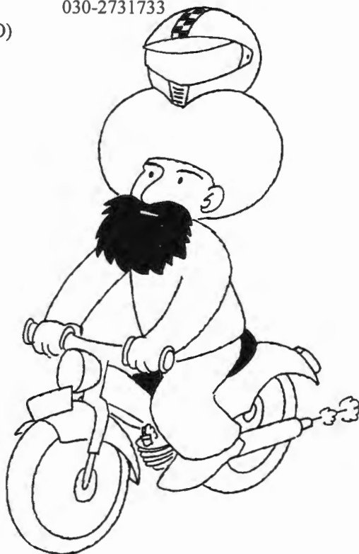
blz.18 'Sikh met tulband op brommer'

Open aanbod Post Academisch Onderwijs Katholieke Theologische Universiteit Utrecht. Info: 030-2731733