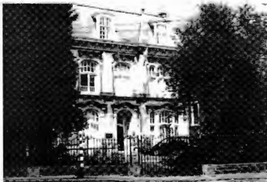
Het landelijk kantoor van de ISN aan de Javustraart 2, 2585 AM Den Haag

schijnlijkheid nog mede het gezicht van de islam in Nederland bepalen..