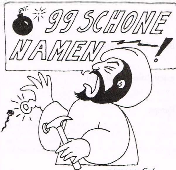
...namen van God.

van de '99 schone namen van God'. Moslims hebben die namen niet zonder reden tezamen gebracht. In de Koran wordt nadrukkelijk gesteld: "God komen de mooiste namen toe. Roept Hem daarmee aan en laat hen maar die Zijn namen misbruiken; aan hen zal worden vergolden wat zij deden." (sura 7:180) Niet alle islamitische theologen zijn het eens over de rangschikking van deze namen. Ibn Taimiyya (gest. 1328) merkt op, dat enkele belangrijke namen die in de Koran geregeld voorkomen - Heer (rab) bijvoorbeeld - in deze lijst niet worden genoemd. Andere namen voor God die minder vaak in de Koran voorkomen, zijn echter weer wel in de lijst terecht gekomen. Ondanks enkele kritische geluiden speelt deze rangschikking