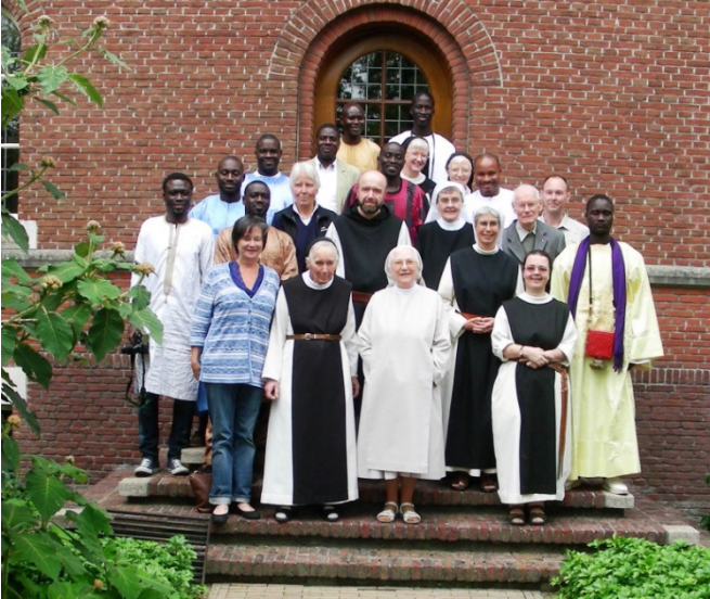
Abdij Nazareth Brecht (B.) Soefi's en Benedicti- nessen

hun interreligieuze gesprekken niet alleen van hun geloof te getuigen, maar ook te luisteren en te ervaren hoe God bij de anderen al aanwezig is. Er is een positieve waardering voor het goede dat zij aantreffen bij andersgelovigen.