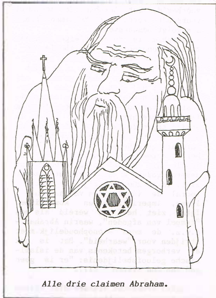
Alle drie claimen Abraham.

In dat geval zijn we niet verder dan de bekende parabel van de ring door Lessing verteld in Nathan der Weise . Ieder van de drie zonen claimt de echte ring te bezitten, maar één kan slechts de echte hebben. Zou het ook kunnen zijn, dat ze alle drie een