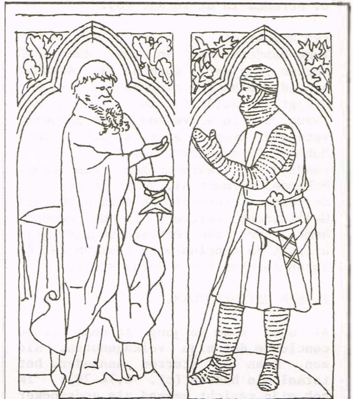
Abraham en Melchisedek (Gen. 14) Kathedraal van Reims ± 1251.

Toen Abraham dan zijn plicht van gehoorzaamheid in godsvrucht vervuld had, zeide God tegen hem: nu weet Ik, dat gij God vreest. Dit moet men zo opvatten, dat God gemaakt heeft, dat Abraham zichzelf leerde kennen." (6).