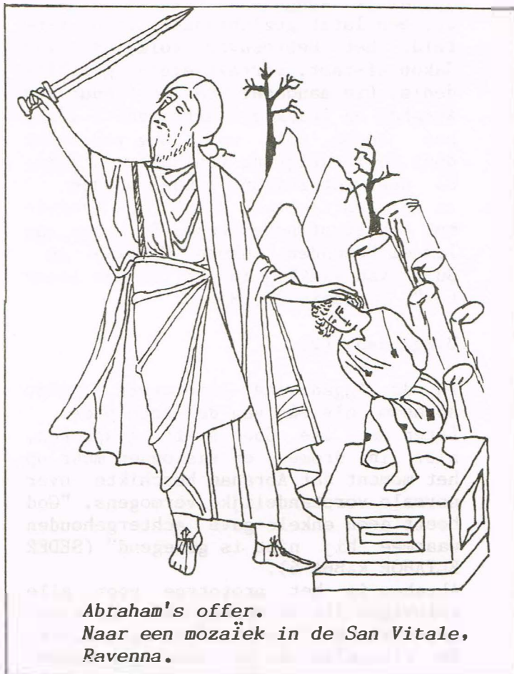
Abraham's offer. Naar een mozaïek in de San Vitale, Ravenna.

De Heilige - Hij zij geprezen - sprak tot Abraham: "Laat de 22 letters komen om te getuigen tegen Israël". Toen zij verschenen trad de alief naar voren om te getuigen dat Israël